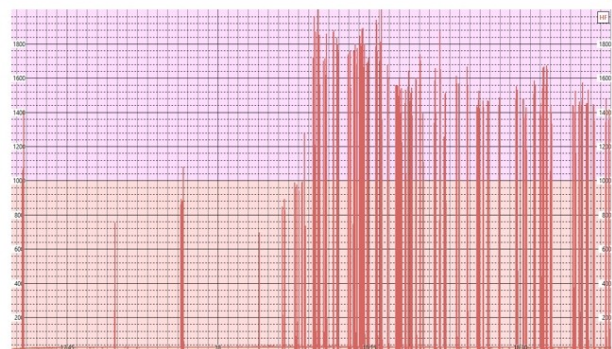
Log 3: Kamstrup AMS Slave (konsentratorpunkt)