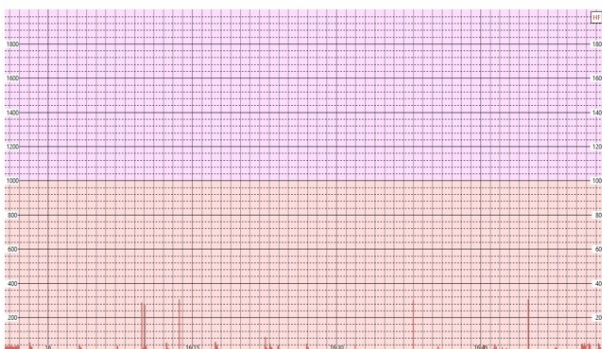
Log 1: Samsung S7 med kun GSM, uten wifi, Bluetooth og 4G (i passiv tilstand, telefonen bare ligger på bordet).

For å sammenligne de elektromagnetiske feltene fra mobiltelefon og de nye Smartmålerne (AMS) har EMF CONSULT gjennomført 1 times log på 3m avstand med identisk skalering på graf (maks 2.000 \mu\text{W}/\text{m}^2 ).