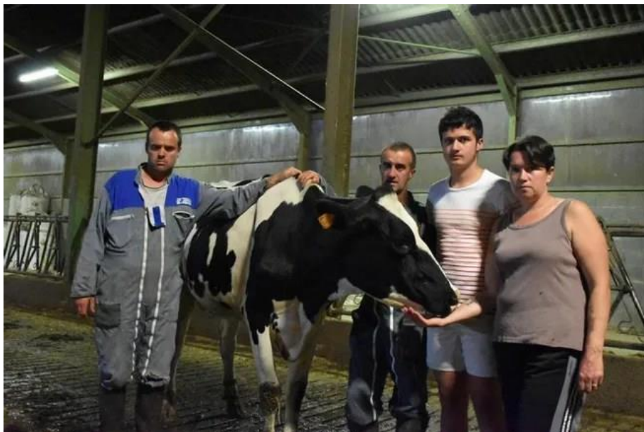
Her har vi bonden med familie og ei av kyrne. 40 er døde på få år. Og kalver er blinde.

Denne teksten ble først publisert på http://einarflydal.com den 14.06.2022